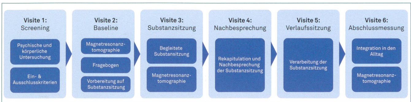
Abbildung 2: Studienverlauf. Die Studie besteht aus sechs Visiten, die an der Psychiatrischen Universitätsklinik stattfinden und zwei weiteren Follow-ups, bei denen Fragebogen Zuhause ausgefüllt werden. Die Visiten an der Psychiatrischen Universitätsklinik beinhalten die Abklärung der Ein- und Ausschlusskriterien, Magnetresonanztomographie, Fragebogen, Vorbereitung auf die Substanzsitzung, die Substanzsitzung selbst und anschliessend die Verarbeitung der Substanzsitzung. Am Tag der Substanzsitzung nehmen PatientInnen entweder Psilocybin oder Placebo ein und werden vom Studienteam betreut. Ziel der Studie ist es herauszufinden, ob und wie eine einmalige Psilocybineinnahme die Alkoholabstinenz bei PatientInnen mit einer Alkoholabhängigkeit unterstützen kann.

Wie zuvor erwähnt, ist es notwendig, placebokontrollierte, doppelverblindete Studien durchzuführen, um Wirksamkeit und Wirkmechanismen der psychedelikagestützten Therapie zu untersuchen. Genau dies wird an der Psychiatrischen Universitätsklinik Zürich momentan gemacht (siehe Abbildung 2 für den Studienverlauf). Im Februar 2020 begannen wir mit der Rekrutierung, welche voraussichtlich bis im Herbst 2021 andauern wird. Die Studie wird geschätzt im Frühling 2022 abgeschlossen. 1 Auf Grund der