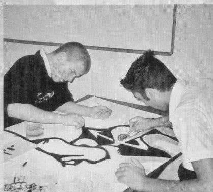
Gruppenarbeit in der Klasse: eine Zeichnung im Grossformat.

Im Classe-atelier gelingt es, sie mit vereinter Kraft für Schularbeiten zu gewinnen. Dahinter steht das Motto: