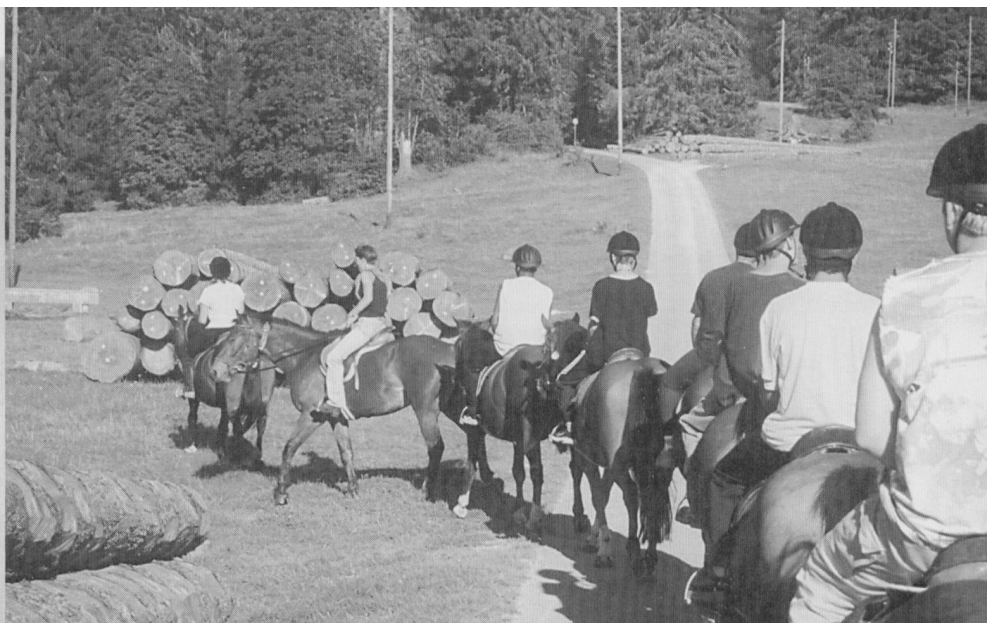
Reitausflug in der ersten Kontaktwoche zu Beginn des Schuljahres.

«Wenn sie es jetzt nicht schaffen, werden sie es nie schaffen.»