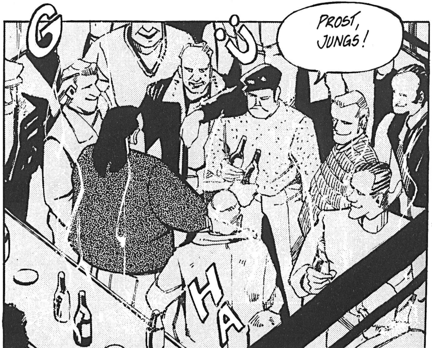
Illustration aus: JIRAI SHIN, die Macht des Schicksals – Matz Mainka/Tsutomu Takahashi.