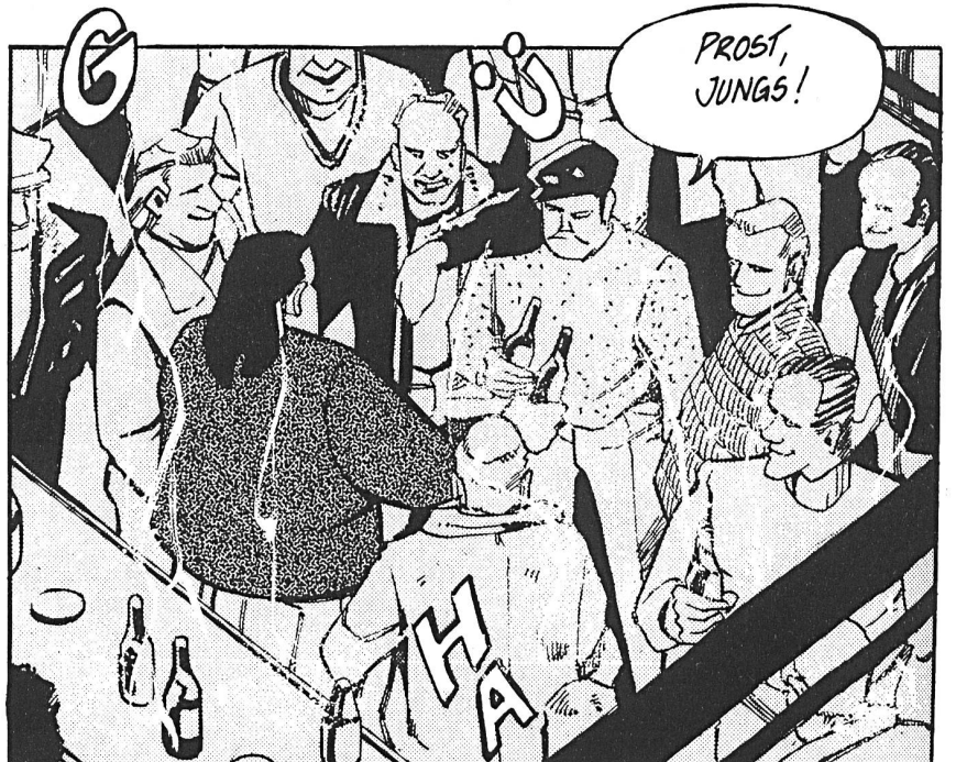
Illustration aus: JIRAI SHIN, die Macht des Schicksals – Matz Mainka/Tsutomu Takahashi.