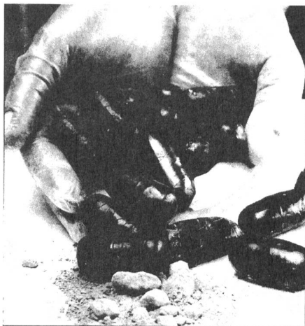
Die „Drogeneselinnen“ müssen oft Dutzende solcher mit Kokain gefüllter Kapseln verschlucken.

Für den Transport bekommen die „Burra“, die „Eselinnen“, rund 3000 Dollar. „Wer könnte da angesichts der grossen Not widerstehen?“ fragt Doris Hug. Für ihre Risikobereitschaft werden die Frauen allerdings streng bestraft, mit Gefängnis bis zu 16 Jahren. „Und ihre Strafe fängt nach der Rückkehr in die Heimat nochmals von neuem an“, wie die Psychologin aufgrund ihrer Erfahrungen betont: Das Kind, das sie seinerzeit als Säugling mitnahmen und im Schweizer Gefängnis aufzogen, wird zu Hause sofort krank, auch wenn es in Hindelbank bereits nach und nach auf die künftige magerere Nahrung vorbereitet wurde. Die Familien verübeln den Frauen ihre lange Abwesenheit, auch wenn sie davon finanziell ganz schön profitiert haben, und sie erwarten bei der Rückkehr noch viel mehr Geld. Die Wiedereingliederung ist schwierig. Und dazu kommt noch die Angst vor der Rache der Auftraggeber: Wie Doris Hug erzählt, gehen zahlreiche Entlassene darum gar nicht nach Hause, sondern verstecken sich bei Verwandten auf dem Land.