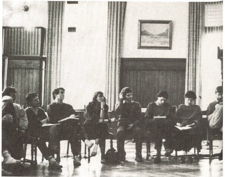
Teilnehmer am Workshop in Richenthal