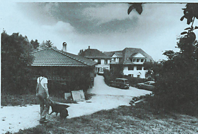
Die therapeutische Wohngemeinschaft Aebihus in Leubringen