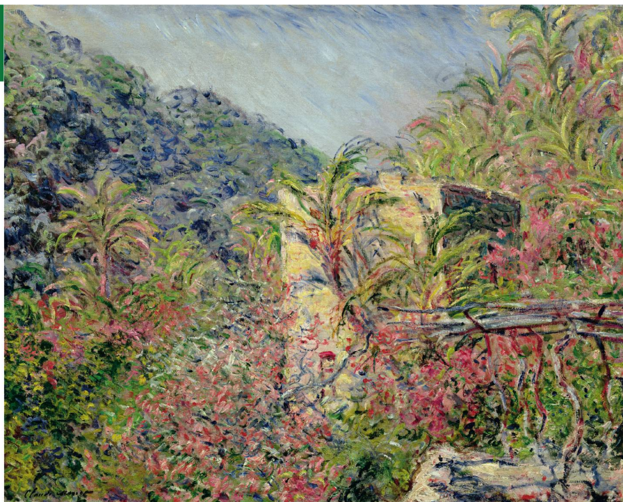
Claude Monet, Vallée de Sasso, effet de soleil , 1884, Huile sur toile, 65 x 81 cm – Paris, Musée Marmottan Monet – Exposition « Hodler, Monet, Munch. Peindre l'impossible », Paris.

Kunstmuseum, Museumstrasse 32, CH-9000 Saint-Gall. Jusqu'au 23 octobre 2016, du mardi au dimanche de 10 h à 17 h, mercredi jusqu'à 20 h.