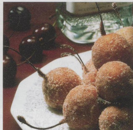
Pro Gastronomía, une Fondation Nestlé

Boisson accompagnante : riesling-sylvaner ou dorin de la côte.