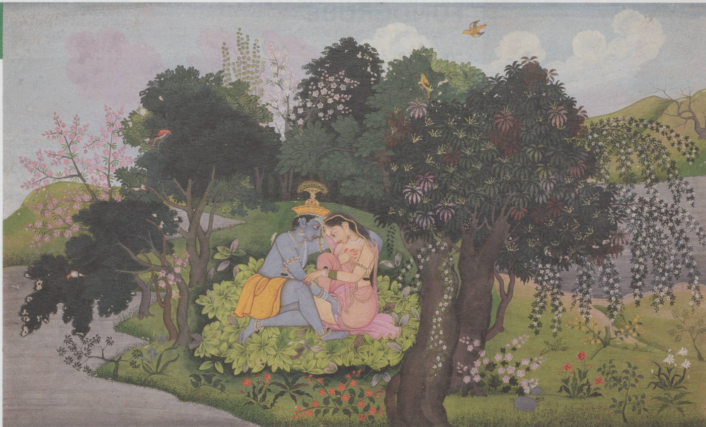
Krishna und Radha als Liebespaar in einer paradisiischen Landschaft , Gemalt von einem Nachkommen der ersten Generation des Künstlers Nainsukh von Guler Indien, Pahari-Region, 1775/1780, Dauerleihgabe Barbara und Eberhard Fischer © Museum Rietberg Zürich, Foto: Rainer Wolfsberger - Exposition Jardins du monde, Zurich

Jusqu'au 16 octobre 2016, du mardi au dimanche de 11 h à 18 h.