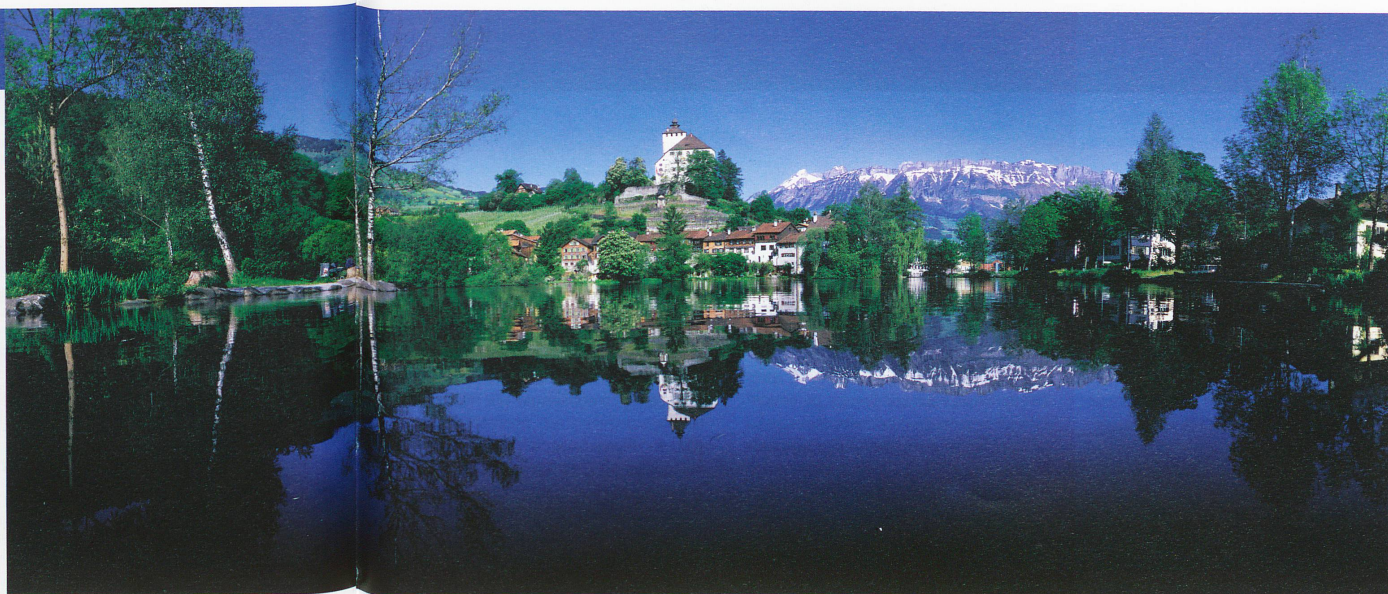
Château et petite cité de Werdenberg (XIII e s.) dans le Rheintal saint-gallois.

■ Le projet gouvernemental d'autonomisation de l'Office des véhicules a été rejeté à 64,8 % par les citoyens. Ceux-ci ont été sensibles aux arguments de la Gauche qui dénonçait une première étape vers la privatisation de ce service de l'État.