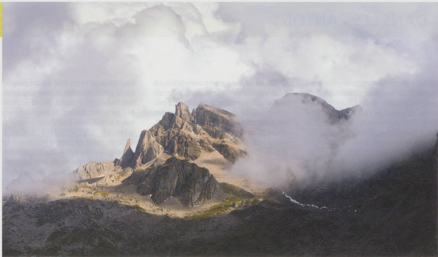
Roches déchiquetées au-dessus d'Oberrickenbach (NW).