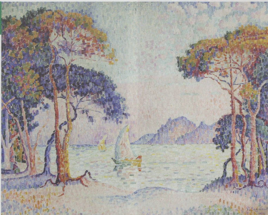
Paul Signac, Juan-les-Pins. Soir, 1914 , huile sur toile, 73 x 92 cm, collection privée, © photo Maurice Aeschmann – Exposition Paul Signac, Lausanne.

Zoo Galerie, 49 Chaussée de la Madeleine, 44000 Nantes. Jusqu'au 20 février 2016, du lundi au samedi de 14 h 30 à 19 h.