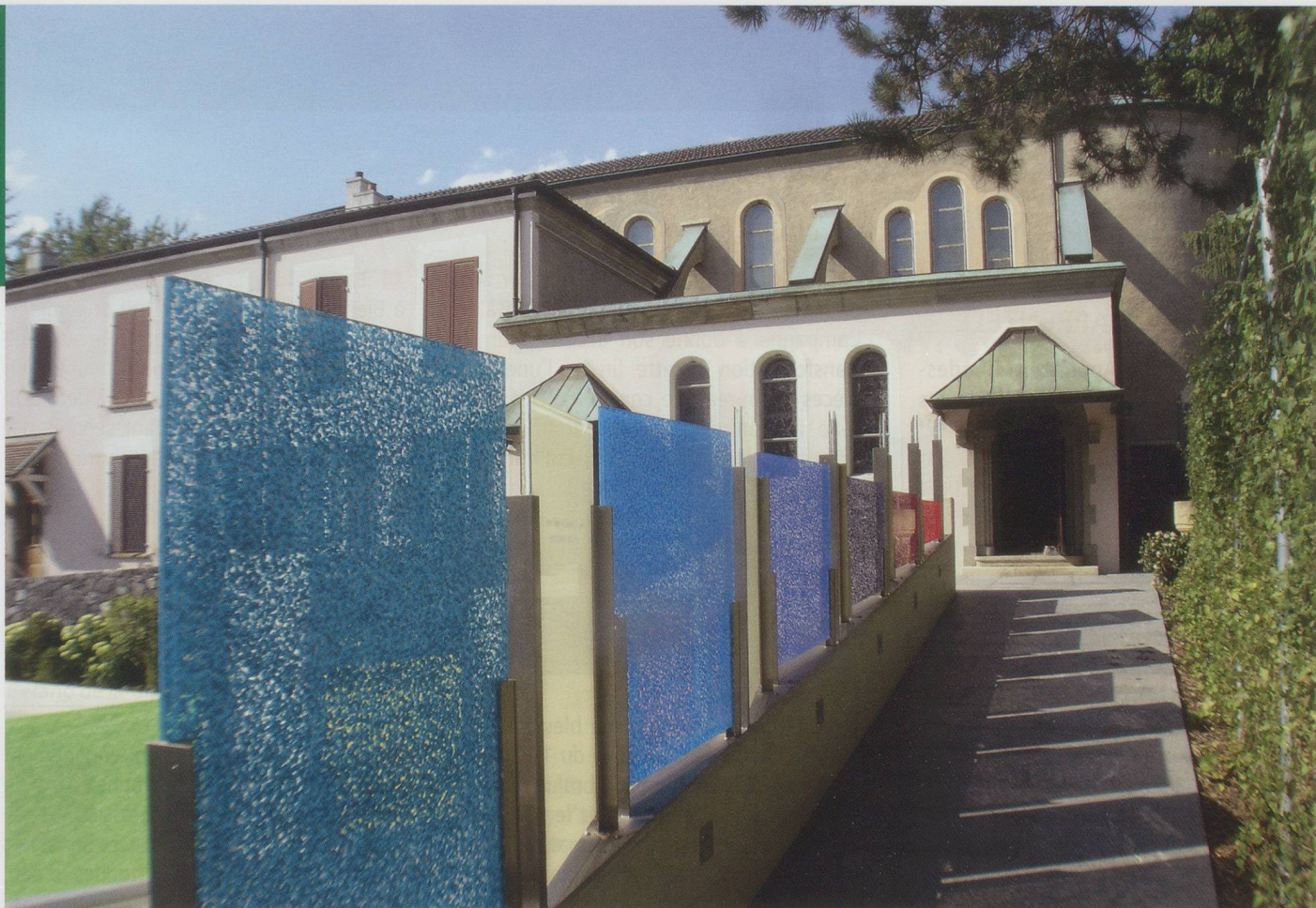
La paroisse du Sacré-Cœur à Lausanne : sur chaque stèle est gravée une citation de M. Zundel.

sion 5 . » Revenant à nouveau en France, Zundel organise des retraites et est aumônier à Neuilly.