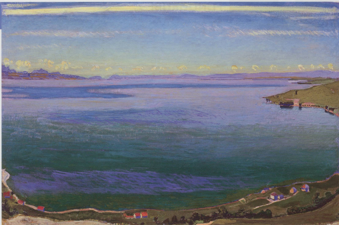
Hodler Ferdinand Hodler : Le Lac Léman vu de Chexbres , vers 1904, huile sur toile 80 x 99 cm - Exposition « Anke, Holder, Vallotton... » Chef-d'œuvre de la Fondation pour l'art, la culture et l'histoire, Martigny.

Fondation Gianadda, rue du Forum 59, CH-1920 Martigny. Jusqu'au 14 juin 2015, tous les jours de 9 h à 19 h.