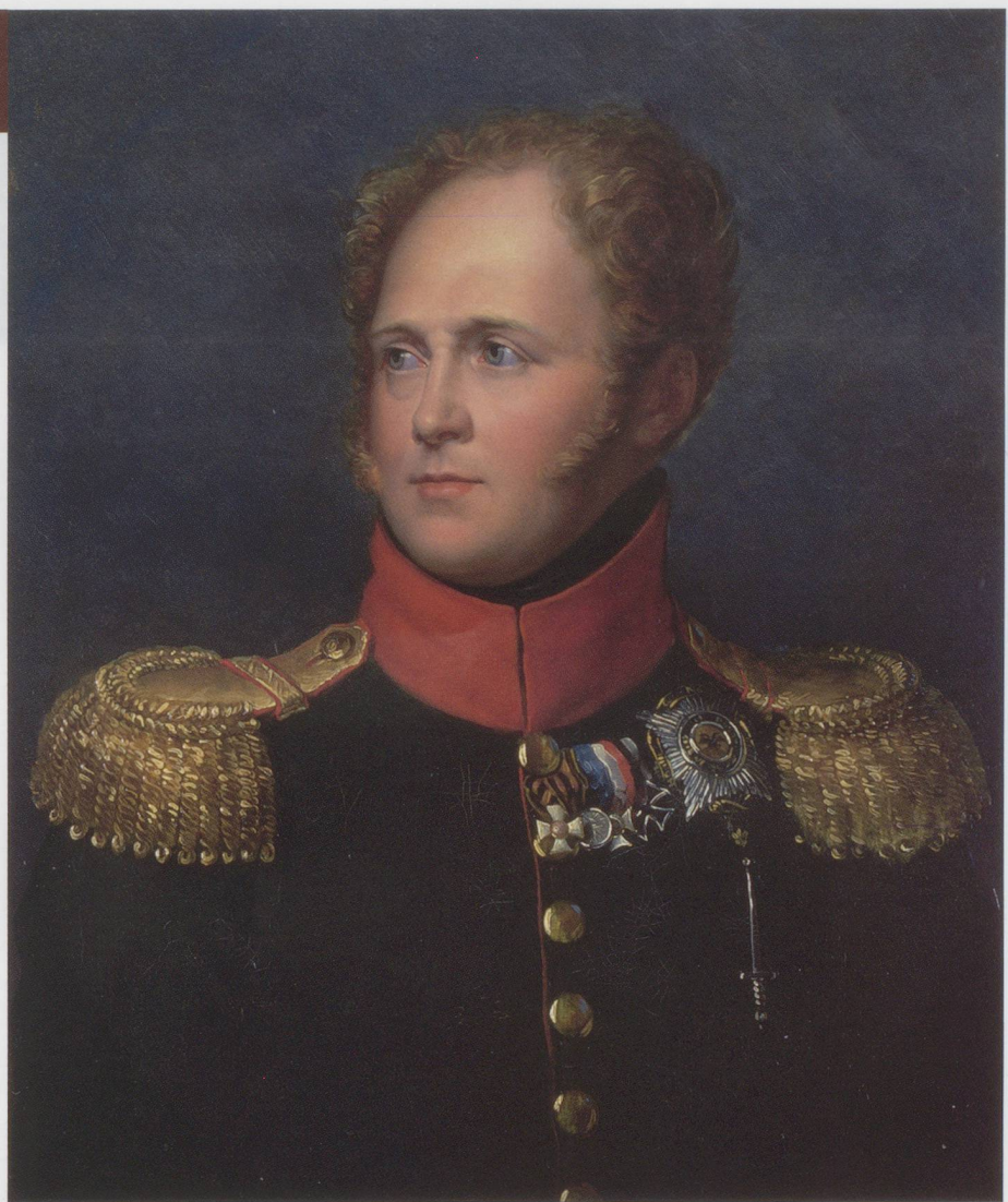
François Gérard : l'empereur Alexandre I er vers 1815, huile sur toile, 1838, Musée cantonal des Beaux-Arts de Lausanne, legs du général Frédéric-César de La Harpe.

Chronique « Ces Suisses qui ont créé la France » n° 54 – En partenariat avec les Archives de la Ville de Fribourg/CH