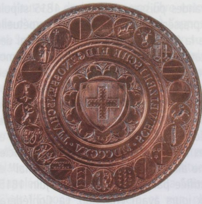
Musée national suisse.