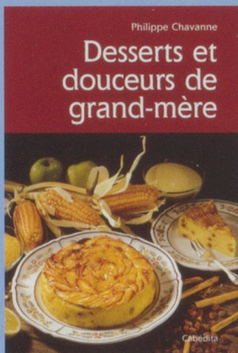
Desserts et douceurs de grand-mère Philippe Chavanne

Au travers de plus de 70 recettes, cet ouvrage nous remet en mémoire les plus fabuleuses préparations de desserts et de petites douceurs confectionnées jadis par nos grands-mères. Des recettes faciles à préparer et confectionnées avec les meilleurs produits.