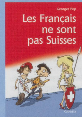
Les Français ne sont pas Suisses Georges Pop

Prix : 18 € - 48 pp. - ISBN 978-2-88295-697-2