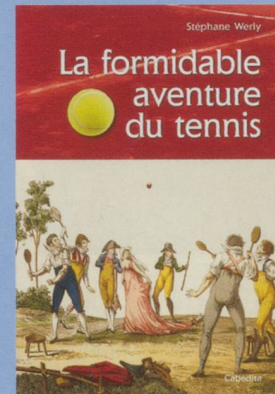
La formidable aventure du tennis Stéphane Werly

Prix : 26,50 € - 360 pp. - ISBN 978-2-88295-531-9