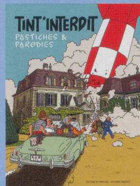
Tint'Interdit Alain-Jacques Tornare

Prix : 22 € - 160 pp. - ISBN 978-2-88295-717-7