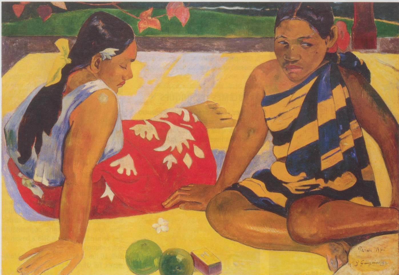
Paul Gauguin, Parau api , 1892, Quelles nouvelles ? Huile sur toile, 67 x 91 cm, Gemäldegalerie Neue Meister, Staatliche Kunstsammlungen Dresden.