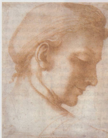
Baccio Bandinelli, Étude de tête vue de dos, de profil vers la droite, vers 1518, sanguine, 250 x 196 mm, Collection Jean Bonna, Genève.

Fondation Tissières, musée des sciences de la Terre, avenue de la Gare 6, CH-1920 Martigny, jusqu'au 29 mars 2015, mardi, jeudi, samedi et dimanche de 13 h 30 à 17 h. Des œuvres d'artistes sont également exposées durant la même période au Musée et Chiens du Saint-Bernard, Fondation Bernard et Caroline de Watteville, rue du Levant 34, CH-1920 Martigny, du mardi au dimanche de 10 h à 18 h.