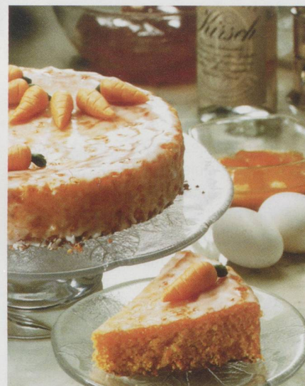
Tourte aux carottes.

Préparation : Faire mousser les jaunes d'œufs avec sucre, jus de citron et zeste de citron. Ajouter les carottes râpées et les amandes. Ajouter fécule, cannelle, poudre de girofle et poudre à lever, toujours en mélangeant. Ajouter ensuite le kirsch. Incorporer délicatement les blancs d'œufs en neige. Cuire au four pendant 60 min à 180 °C dans un cercle de 24 cm de dia-