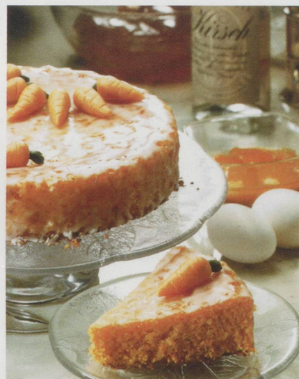
Tourte aux carottes.

Préparation : Faire mousser les jaunes d'œufs avec sucre, jus de citron et zeste de citron. Ajouter les carottes râpées et les amandes. Ajouter féculé, cannelle, poudre de girofle et poudre à lever, toujours en mélangeant. Ajouter ensuite le kirsch. Incorporer délicatement les blancs d'œufs en neige. Cuire au four pendant 60 min à 180 °C dans un cercle de 24 cm de dia-