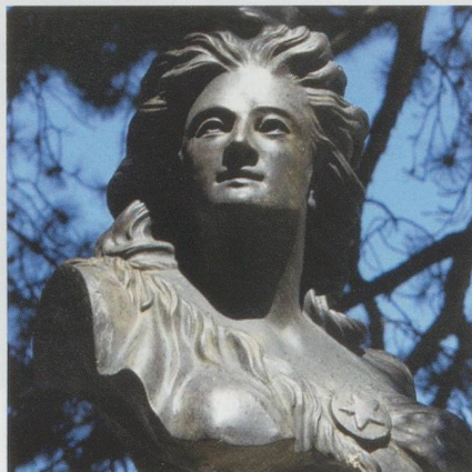
"Helvetia", de Gustave Courbet

Depuis les guerres de religion, la Suisse a été une terre d'accueil pour les réprouvés de l'Histoire, pour les personnes dont la vie était en danger. Certains ont profondément marqué notre pays, comme Jean Calvin à Genève. Plus récemment, de nombreux souverains, chassés de leur pays, s'y sont installés provisoirement ou non. La famille exilée la plus célèbre est sans doute la famille Napoléon (voir Suisse Magazine n° 237-238). Le futur Napoléon III a sans doute plus vécu en Suisse qu'en France. Il y suit ses études, fait son service militaire, parle parfaitement le suisse alémanique. Un Musée Napoléon est consacré à la famille, dans le château d'Arenenberg (TG). Le dernier empereur d'Autriche Charles et son épouse Zita, accompagnés de leurs sept enfants, passent en Suisse sur leur long chemin d'exil. Ils logent d'abord à Wartegg, le château des Habsbourg (TG), à Hertenstein (LU) puis à la Villa Prangins de Nyon. L'impératrice Zita de Habsbourg meurt, à l'âge de 96 ans à Zizers (GR). Une des nièces de Zita, Anne de Bourbon-Parme, a épousé Michel de Roumanie, monté deux fois sur le trône de Roumanie et dernier chef d'État de la Seconde Guerre mondiale encore vivant. Chassé par les communistes, Michel s'installe à Lausanne en 1949, puis à Versoix en 1955. Il vit aujourd'hui entre la Suisse (Aubonne, VD) et la Roumanie (il a