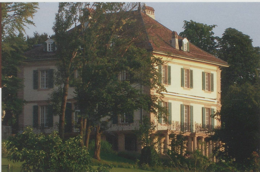
La Villa Diodati où furent conçus les personnages de Frankenstein et de Dracula

Mais la Suisse n'a rien d'effrayant ou de repoussant. Que ce soit pour des raisons fiscales, parce qu'ils apprécient nos splendides paysages ou simplement parce qu'ils sont séduits par l'anonymat dont ils sont l'objet, beaucoup d'étrangers célèbres se sont fixés en Suisse. Et bien peu le regrettent. Y a-t-il un autre pays dans le monde où les « stars » sportives, artistiques ou économiques peuvent couler des jours heureux sans crainte d'être importunées à tout moment ? Il est impossible de citer tous les hommes d'affaires, les écrivains ou artistes, les tennismen ou les coureurs automobile qui résident en Suisse, tant ils sont nombreux. Les stations comme Crans-