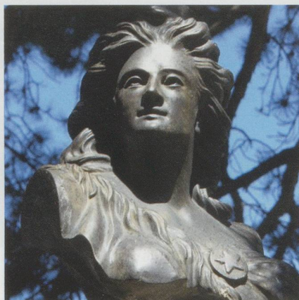
"Helvetia", de Gustave Courbet

Depuis les guerres de religion, la Suisse a été une terre d'accueil pour les réprouvés de l'Histoire, pour les personnes dont la vie était en danger. Certains ont profondément marqué notre pays, comme Jean Calvin à Genève. Plus récemment, de nombreux souverains, chassés de leur pays, s'y sont installés provisoirement ou non. La famille exilée la plus célèbre est sans doute la famille Napoléon (voir Suisse Magazine n° 237-238). Le futur Napoléon III a sans doute plus vécu en Suisse qu'en France. Il y suit ses études, fait son service militaire, parle parfaitement le suisse alémanique. Un Musée Napoléon est consacré à la famille, dans le château d'Arenenberg (TG). Le dernier empereur d'Autriche Charles et son épouse Zita, accompagnés de leurs sept enfants, passent en Suisse sur leur long chemin d'exil. Ils logent d'abord à Wartegg, le château des Habsbourg (TG), à Hertenstein (LU) puis à la Villa Prangins de Nyon. L'impératrice Zita de Habsbourg meurt, à l'âge de 96 ans à Zizers (GR). Une des nièces de Zita, Anne de Bourbon-Parme, a épousé Michel de Roumanie, monté deux fois sur le trône de Roumanie et dernier chef d'État de la Seconde Guerre mondiale encore vivant. Chassé par les communistes, Michel s'installe à Lausanne en 1949, puis à Versoix en 1955. Il vit aujourd'hui entre la Suisse (Aubonne, VD) et la Roumanie (il a