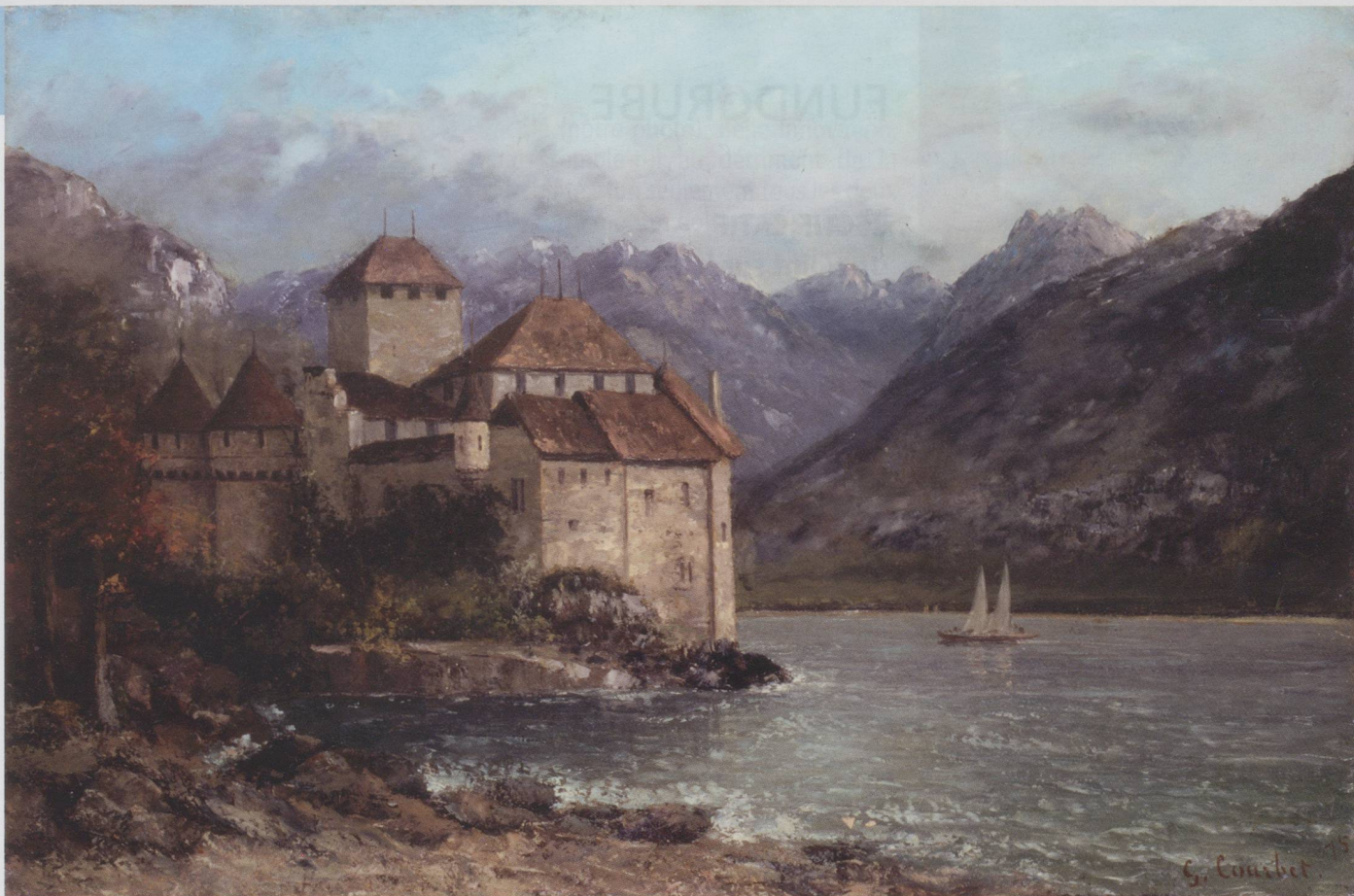
Gustave Courbet, Le château de Chillon, 1875 , Huile sur toile, 62 x 92 cm, Ville de Lons-le-Saunier, Musée des Beaux-Arts - © Studio Eureka, Jean-Loup Mathieu - Exposition « Gustave Courbet, les années suisses », Genève.