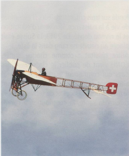
Les avions anciens étaient également en démonstration.