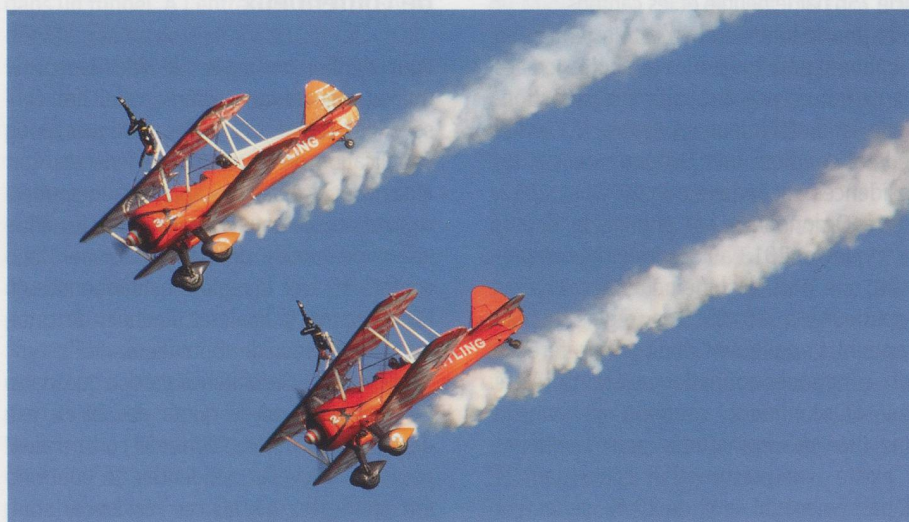
Les Wind Walker, les gymnastes du ciel.