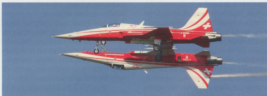
Des F-5 Tiger de la Patrouille suisse.