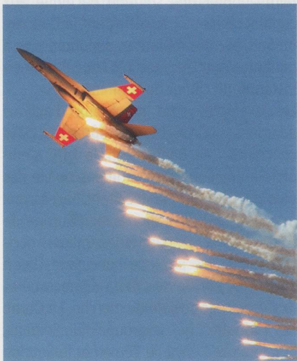
Lâcher de leurres thermiques par un FA-18 suisse.