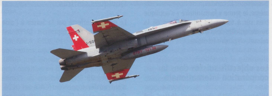
Un FA-18 de permanence.