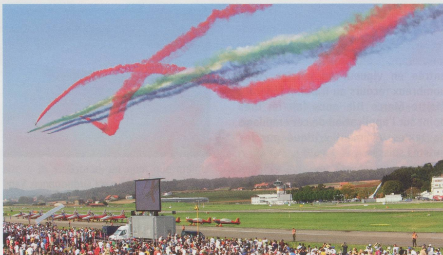
Des présentations hautes en couleurs.

NDLR : Merci à Jacques Schell, photographe notamment du quotidien L'Alsace et du Journal de Marsens pour ce reportage haut en couleurs.