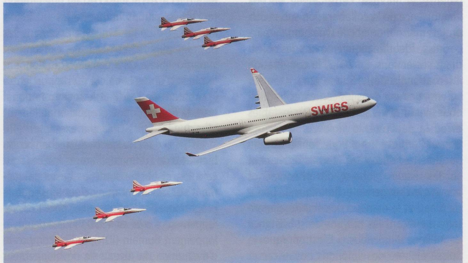
Patrouille suisse encadrant un Airbus 330 de Swiss.