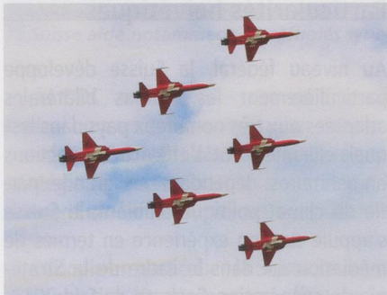
Vol en formation pour la Patrouille suisse.