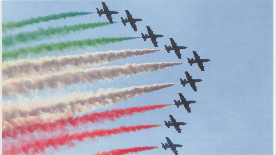
Les Frece Tricolori en action.