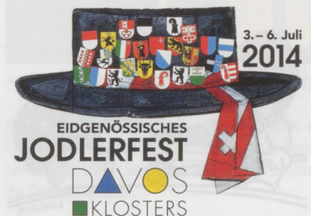
Fête fédérale de yodel à Davos.

■ Pour son 10 e anniversaire, le Festival de la Terre a accueilli 50 000 visiteurs (soit 10 000 à 15 000 de plus que l'an dernier) sur l'Esplanade de Montbenon à Lausanne. Concerts, ateliers pour enfants, débats, défilé de mode éthique ont rencontré beaucoup de succès, à la grande satisfaction des organisateurs bénévoles.