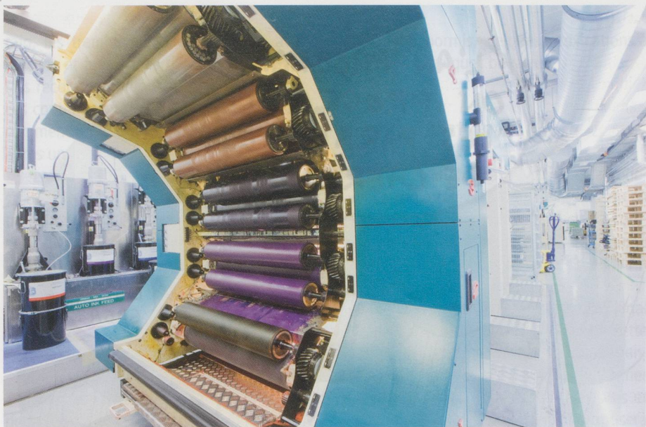
Machine destinée à l'impression sécurisée des billets de banque suisses.

■ Le ministre français des Finances, Michel Sapin, en visite en Suisse, et la conseillère fédérale Eveline Widmer-Schlumpf ont annoncé la signature d'un accord d'assistance administrative fiscale et la fixation d'un calendrier pour réduire à zéro le