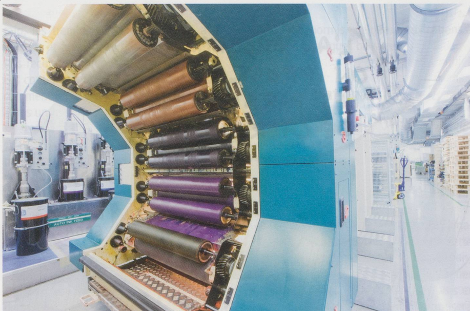
Machine destinée à l'impression sécurisée des billets de banque suisses.

■ Le ministre français des Finances, Michel Sapin, en visite en Suisse, et la conseillère fédérale Eveline Widmer-Schlumpf ont annoncé la signature d'un accord d'assistance administrative fiscale et la fixation d'un calendrier pour réduire à zéro le