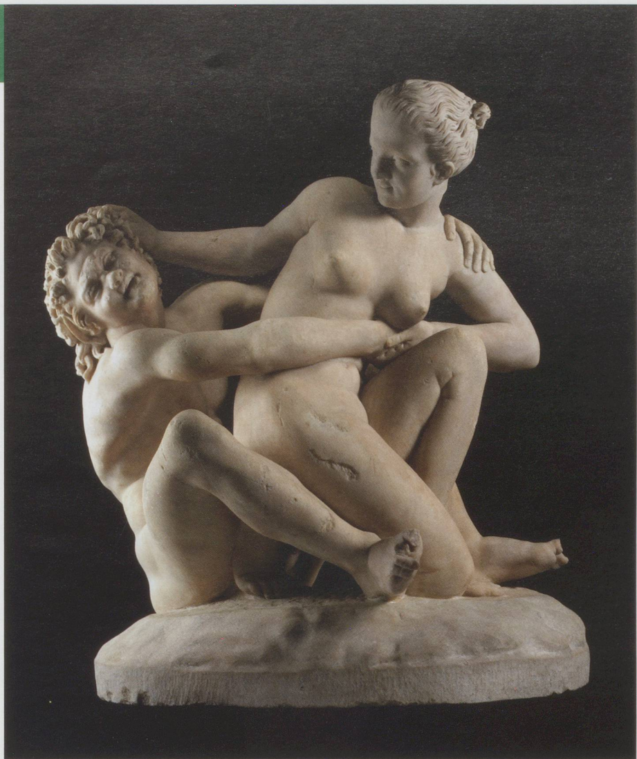
Nymphe et satyre : Marbre, groupe représentant une nymphe – dont la tête a été restaurée au XIX e s. – repoussant les assauts d'un satyre. Période romaine, II e s. apr. J.-C., trouvé près de Tivoli (Latium).

Exposition La beauté du corps dans l'Antiquité grecque, Martigny.