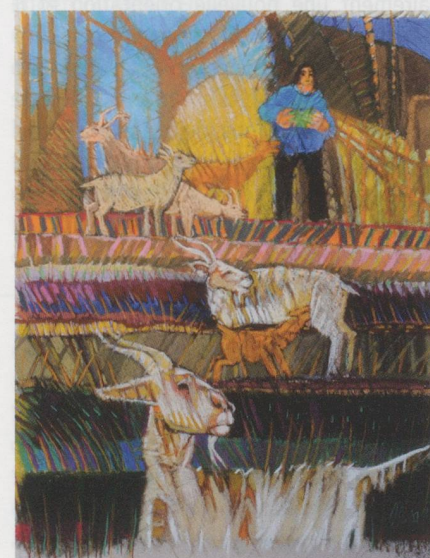
Cesa : Pastel - Exposition Identités italiennes, Musée grüerien, Bulle.