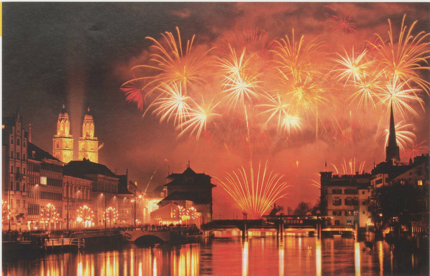
Feux d'artifice du Nouvel An à Zurich.