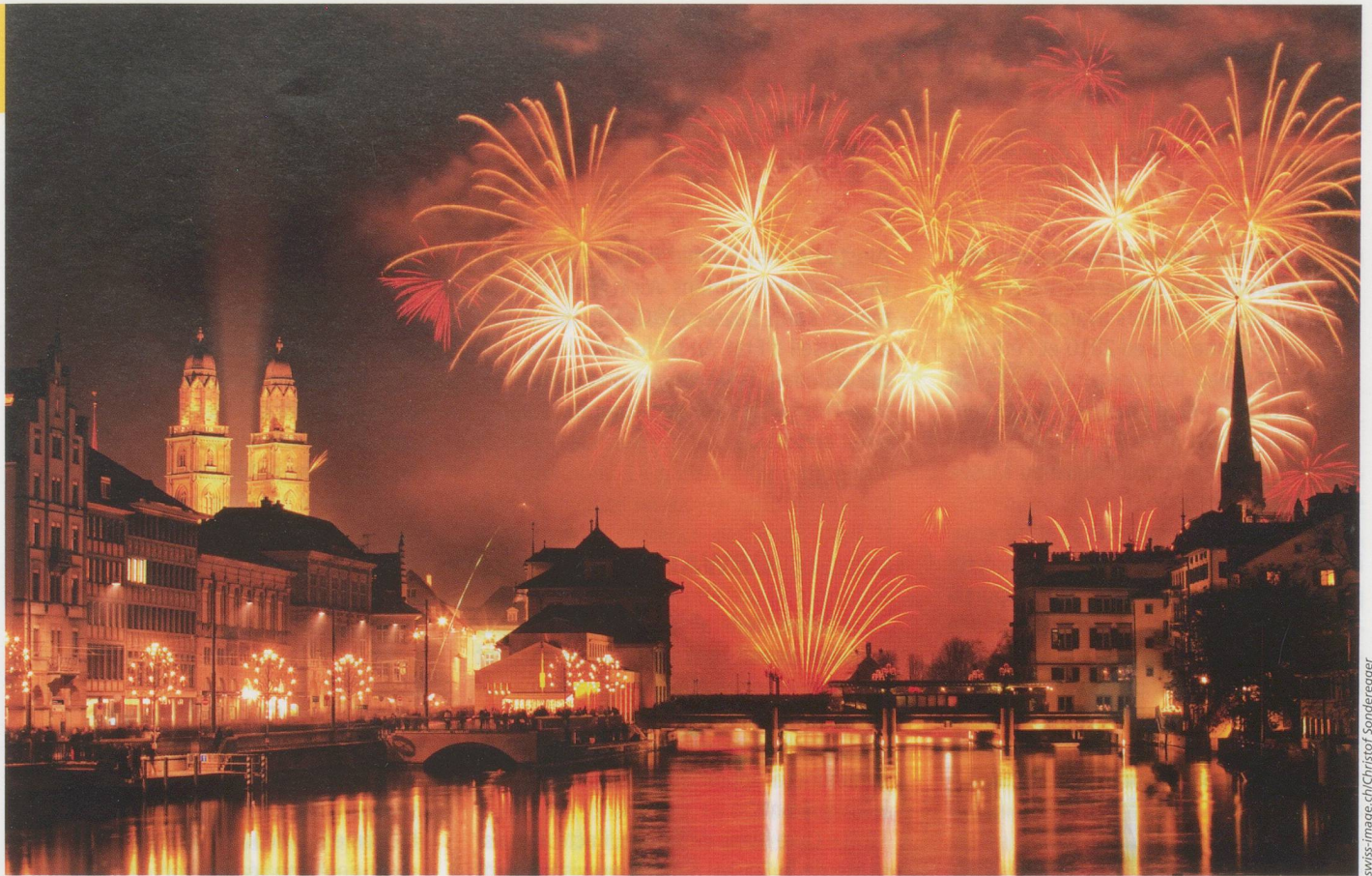
Feux d'artifice du Nouvel An à Zurich.