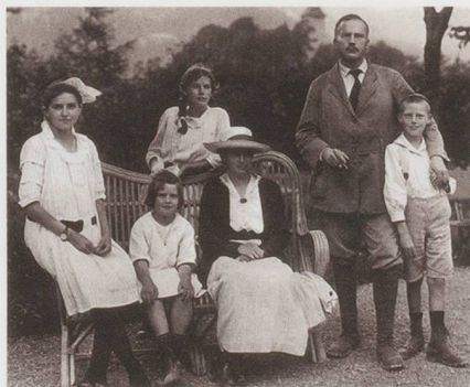
La famille Jung en 1917.

Mais sa famille, faute de moyens, lui demande d'abandonner ses études de médecine et de se tourner vers un métier plus rapidement rémunérateur.