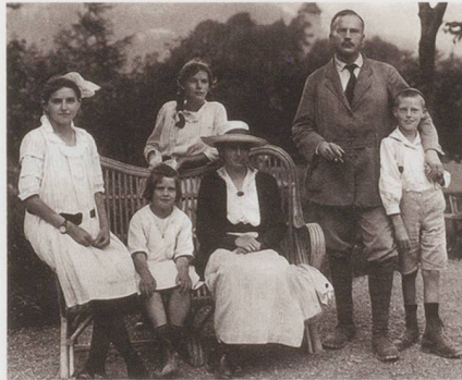
La famille Jung en 1917.

Mais sa famille, faute de moyens, lui demande d'abandonner ses études de médecine et de se tourner vers un métier plus rapidement rémunérateur.