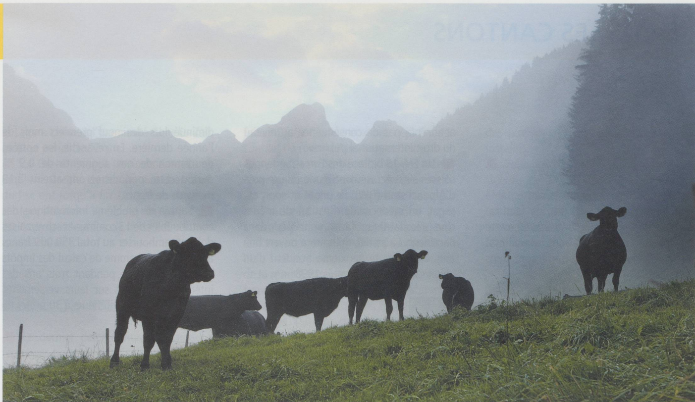
Vaches en train de paître près de Gérignoz au Pays-d'Enhaut (VD), à l'arrière-plan, la Gummfluh, 2 458 m