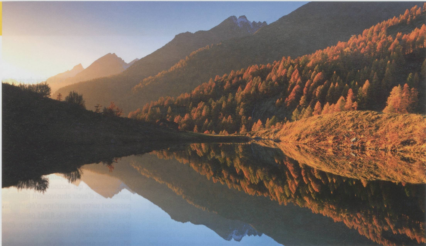
Un coucher du soleil automnal sur le Grundsee, dans le Loetschental (VS)