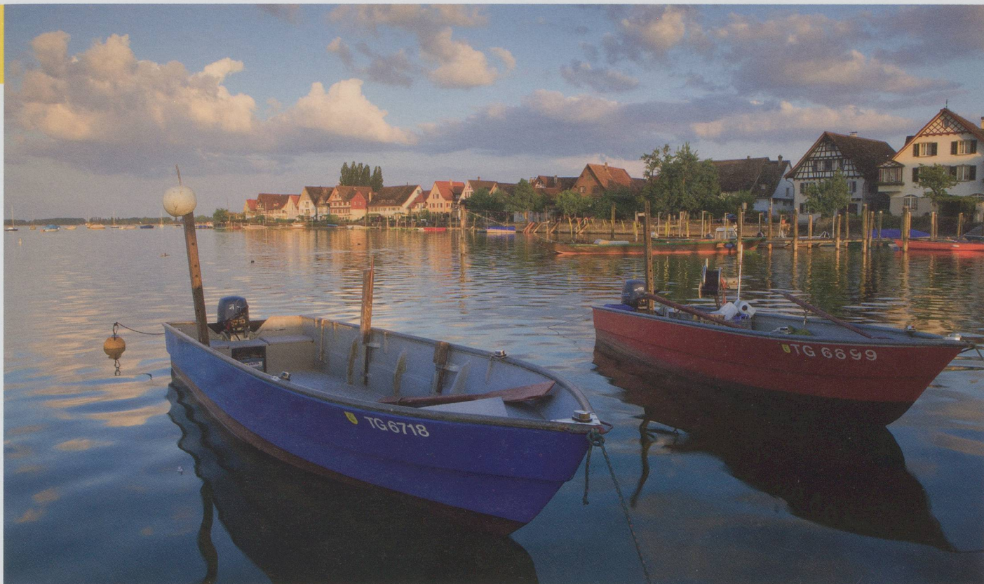
Scène paisible dans le port d'Ermatingen (Thurgovie)