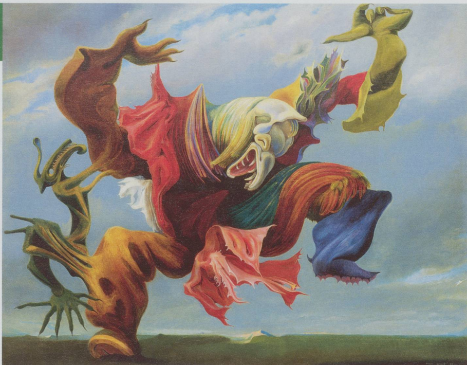
Max Ernst L'Ange du foyer (le Triomphe du surréalisme) , 1937 – Huile sur toile, 114 x 146 cm – Collection privée – © 2013, ProLitteris, Zurich. Exposition Max Ernst, Bâle

Museum im Lagerhaus, Davidstrasse 44, CH-9000 Saint-Gall. Du 27 août au 17 novembre 2013, du mardi au vendredi de 14 h à 18 h, samedi et dimanche de 12 h à 17 h.