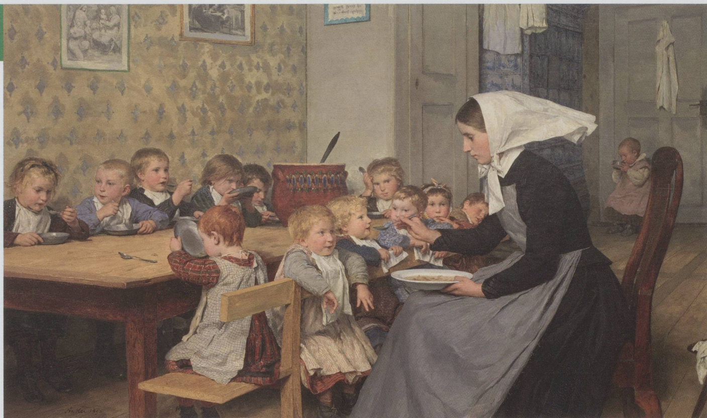
Albert Anker (1831-1910) : Kinderkrippe, 1890 - Winterthur, Museum Oskar Reinhart am Stadtgarten - Exposition Albert Anker und der Realismus in der Schweiz, Schaffhouse