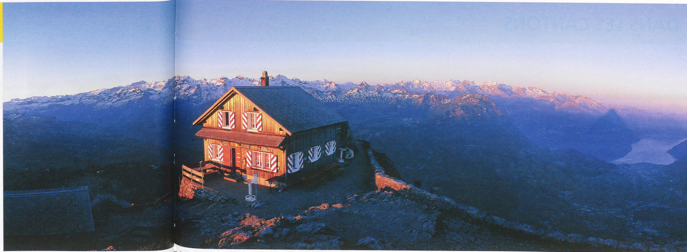
Lumière du matin sur le restaurant du Grand Mythen (1899 m), dans le canton de Schwyz

■ Une motion populaire intitulée « Maintien de l'hôpital de Tavel dans sa fonction actuelle » a été déposée au secrétariat du Grand Conseil fribourgeois. Elle était munie de 327 signatures, soit à peine plus que les 300 requises.