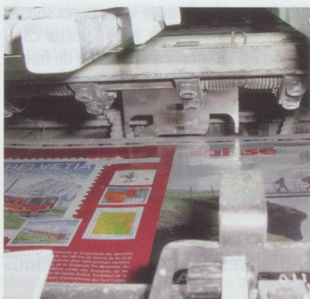
Réception SM 52 Heidelberg 4 couleurs + groupe vernis