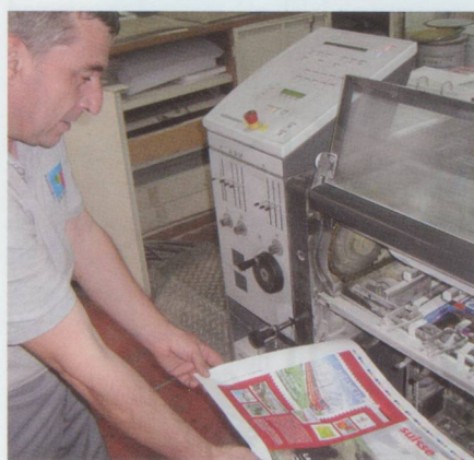
Le « conducteur » contrôle la chromie

S. M. : Le magazine, comme l'imprimerie Chirat, a fait de nombreux efforts dans le domaine du développement durable comme en témoignent les logos Imprim'vert et PEFC page 34. Qu'est-ce que cela signifie précisément pour l'imprimerie ?