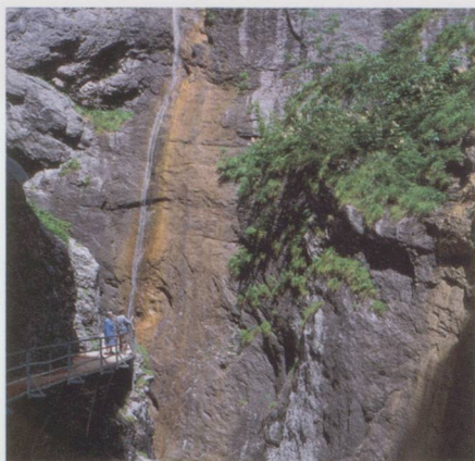
La gorge de l'Aar entre Meiringen et Innertkirchen.