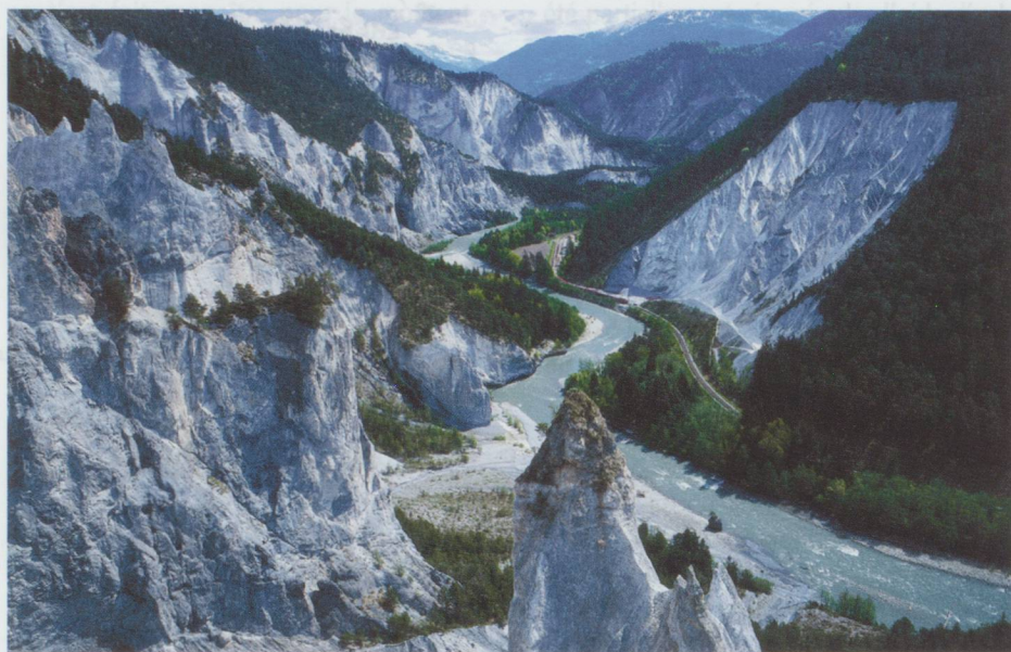
Le Grand Canyon de la Suisse (GR).

Au sud, le Rhône, petit torrent à la sortie de son glacier va enfler grâce à l'apport de ses 38 affluents. Après la longue et belle vallée de Conches, il va irriguer la plaine et passer du côté de Saxon avant de s'évanouir pour une douzaine d'années dans le bleu Léman et se réveiller sous le pont du