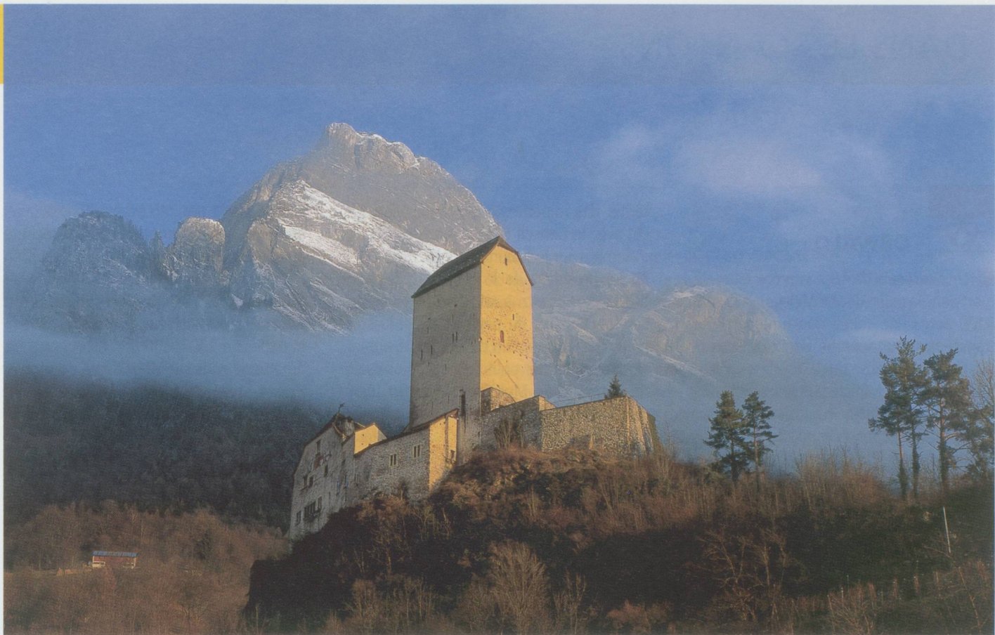
Le château de Sargans (SG). En arrière-plan, le Gonzen, 1 830 m.