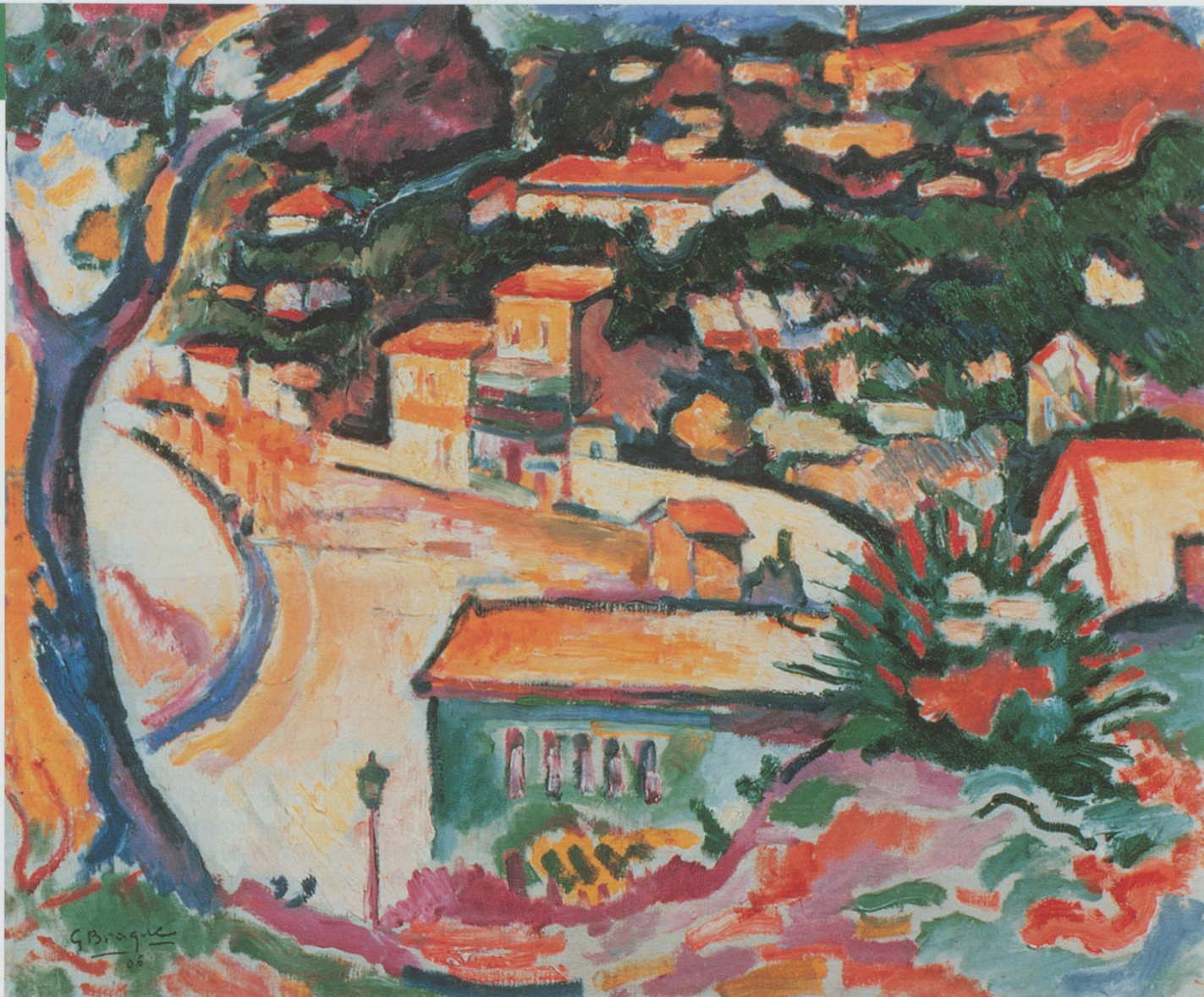
Georges Braque (1882-1963), L'Estaque, 1906, Huile sur toile, 46 x 55 cm, / – exposition à la Fondation Gianadda, Martigny.