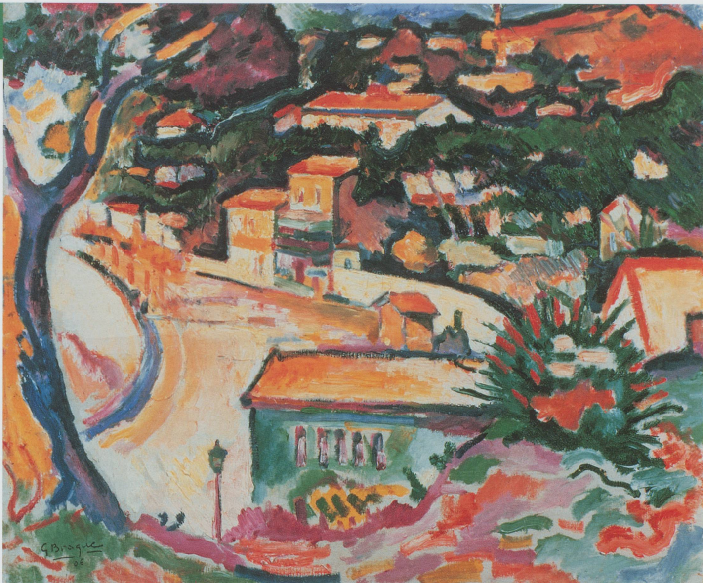
Georges Braque (1882-1963), L'Estaque, 1906, Huile sur toile, 46 x 55 cm, – exposition à la Fondation Gianadda, Martigny.