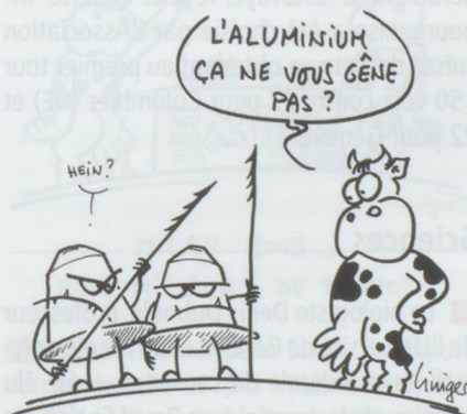
NESPRESSO : CHIFFRE D'AFFAIRES 2011 : 3,5 MILLIARDS DE CHF !

■ Masai Group International, qui fabrique les chaussures physiologiques MBT, est en faillite. La société, qui emploie une cinquantaine de personnes à Winterthour sur un effectif total de 440 salariés, explique ses problèmes par un surendettement et une rude concurrence. Conçues il y a plus de 15 ans par un ingénieur suisse, les chaussures MBT s'inspirent du peuple masai et recréent la sensation de marche pieds nus sur un sol mou, font davantage travailler tous les muscles du corps et redressent la posture avec en sus une diminution des problèmes de dos et d'articulations.