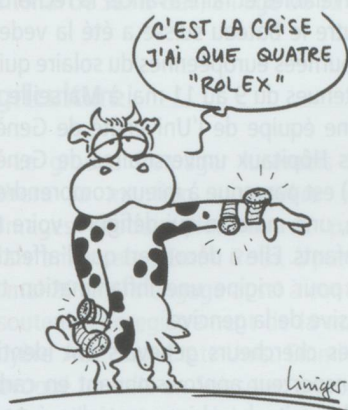
2011 : LE PACTOLE POUR ROLEX

■ L'étude annuelle de la banque Vontobel sur l'horlogerie suisse a livré son verdict. Rolex a engrangé le plus gros chiffre d'affaires en 2011, avec des ventes de près de 4 milliards de francs. Elle devance respectivement Cartier, Omega, Patek Philippe, Longines et TAG Heuer. En ce qui concerne les groupes horlogers, on compte cinq Suisses parmi les dix plus gros chiffres d'affaires de l'an dernier, les trois premières places étant occupées respectivement par Swatch Group, Richemont et Rolex.