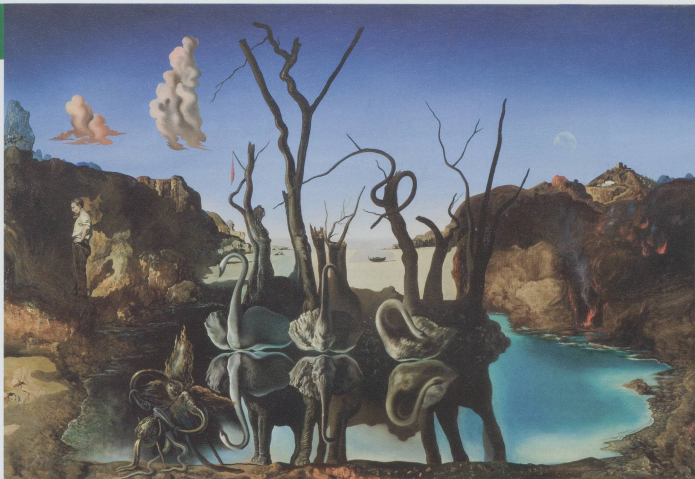
Salvador Dalí : Cygnes réfléchis en éléphants, 1937 - Schwäne spiegeln Elefanten wider - Öl auf Leinwand, 51x77cm - Privatsammlung, Schweiz - Exposition Surréalisme à Paris (Bâle).