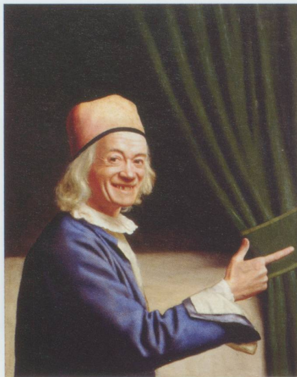
Jean-Étienne Liotard : Liotard riant Vers 1770, Huile sur toile, 84 x 74 cm, Musée d'art et d'histoire, Ville de Genève, inv. N. 1825-11, Exposition Incongru - Quand l'art fait rire (Lausanne)

Musée cantonal des Beaux-Arts, Palais de Rumine, Place de la Riponne 6, CH-1014 Lausanne. Jusqu'au 15 janvier 2012, mardi et mercredi de 11 h à 18 h, jeudi de 11 h à 20 h, du vendredi au dimanche de 11 h à 17 h.