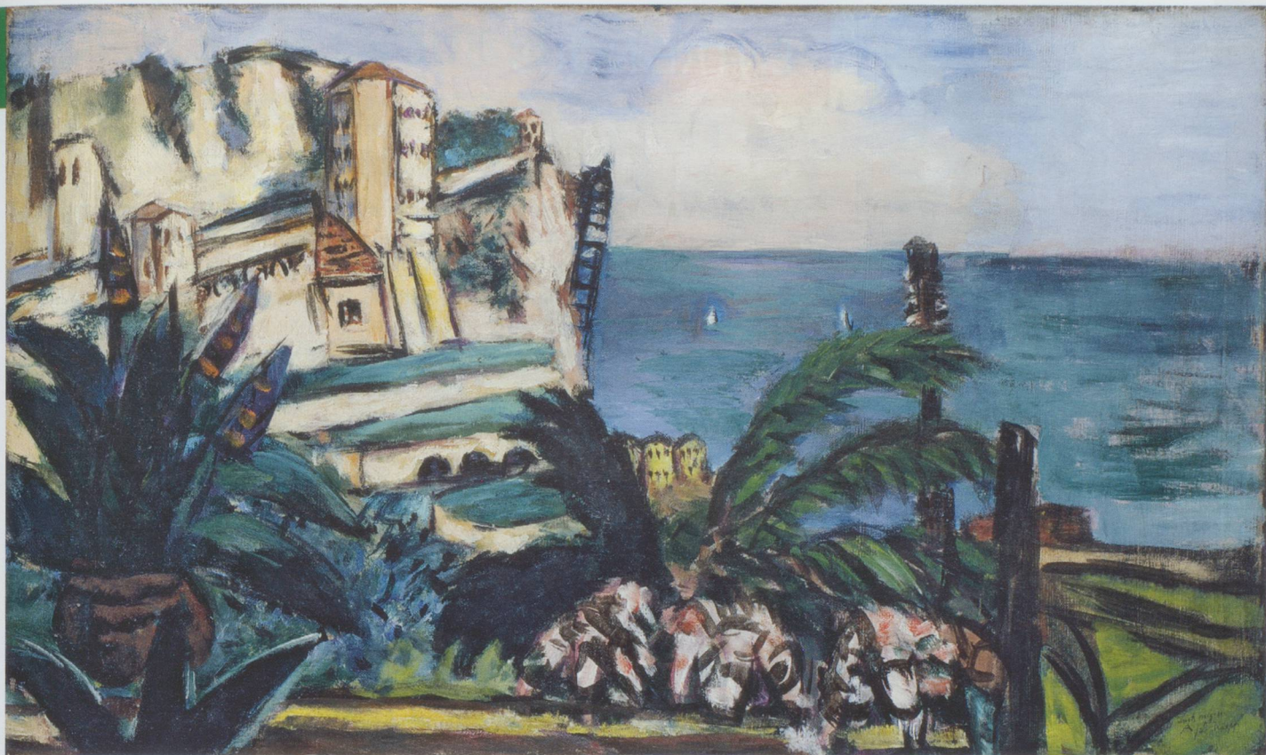
Max Beckmann (1884-1950) : Riviera-Landschaft mit Felsen, 1942 – Öl auf Leinwand – 55,5 x 96 cm – Göpel 594 – Privatbesitz – – Exposition Max Beckmann – Les paysages (Bâle).