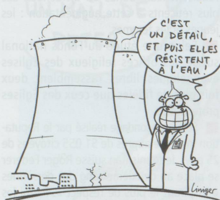
PETITES FISSURES À MÜHLEBERG

■ Les cinq centrales nucléaires suisses sont capables de faire face à des inondations extrêmes, affirme l'Inspection fédérale de la sécurité nucléaire (IFSN). Les centrales de Beznau I et II (AG), Leibstadt (AG) et Gösgen (SO) ont fait la preuve de leur capacité de résistance en cas de crues exceptionnelles. Celle de Mühleberg (BE) a redémarré après trois mois de travaux destinés à augmenter sa sécurité et après avoir reçu le feu vert de l'IFSN. Une décision qui a suscité l'ire des Verts qui considèrent que les fissures détectées dans la centrale constituent toujours un risque pour la sécurité.