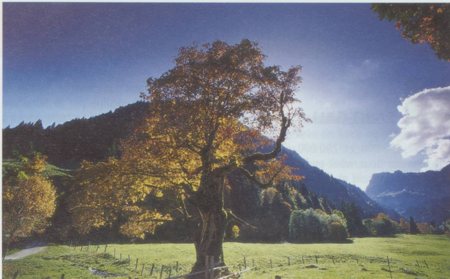
Hinter Richisau dans le Klostental, canton de Glaris.

■ Le gouvernement jurassien veut lancer une réforme de la fiscalité d'une ampleur sans précédent. Ce projet qui doit rendre le canton plus attractif est l'une des priorités du programme gouvernemental de législature. L'un des axes les plus visibles est la baisse des impôts en faveur des personnes