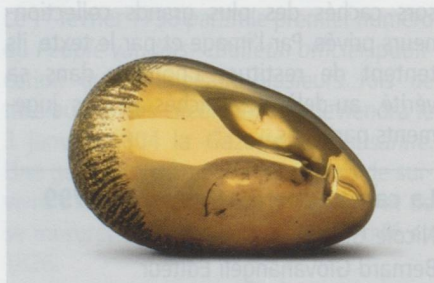
Constantin Brancusi : Muse endormie , 1910 Bronze, 16 x 27,3 x 18,5 cm – Centre Georges Pompidou, Musée national d'art moderne, Paris – Schenkung der Baronin Renée Irana Frachon – © 2011, ProLitteris Zurich – Exposition Constantin Brancusi und Richard Serra (Bâle)

Fondation Beyeler, Baselstrasse 101, CH-4125 Riehen/Bâle. Jusqu'au 21 août 2011, tous les jours de 10 h à 18 h (mercredi jusqu'à 20 h).