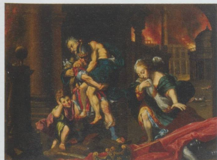
Johann Martin Veith, Aeneas und Anchises ,

Museum zu Allerheiligen, Baumgartenstrasse 6, CH-8200 Schaffhouse. Jusqu'au 21 août 2011, du mardi au dimanche de 11 h à 17 h.