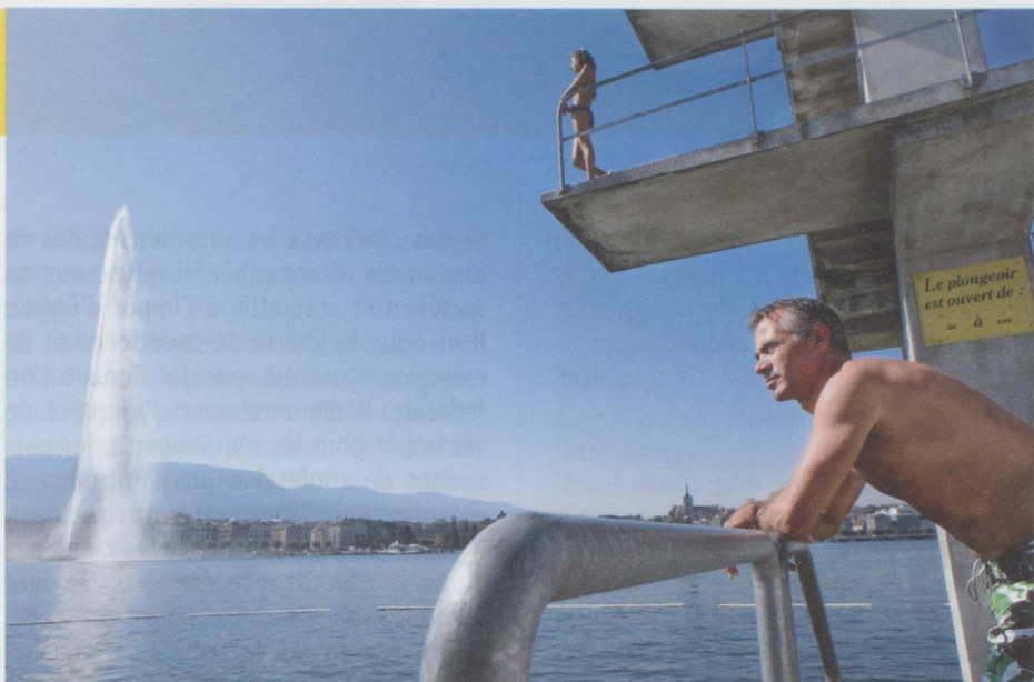
La rade et le jet d'eau de Genève vus des Bains des Paquis.

■ Le Jura veut se doter d'une stratégie énergétique portant sur un horizon de 25 ans qui repose sur la sortie du nucléaire.