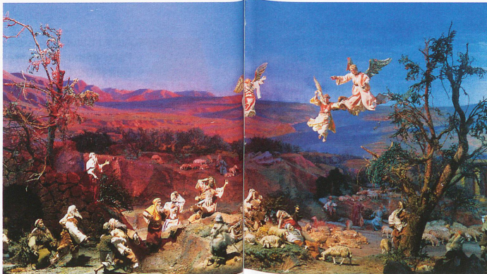
Einsiedeln, l'annonce des anges

Deux musées sont consacrés à cet autre célèbre personnage : à Meiringen (BE), à la sortie des gorges, les chutes en sept paliers du Reichenbach sont célèbres depuis que Conan Doyle l'y a fait mourir (provisoirement). L'autre musée consacré au célèbre détective se trouve à Lucens (VD) et fut créé en 1965 par le fils de Sir Arthur Conan Doyle. Depuis, le musée réaménagé dans la « Maison rouge » de Lucens présente,