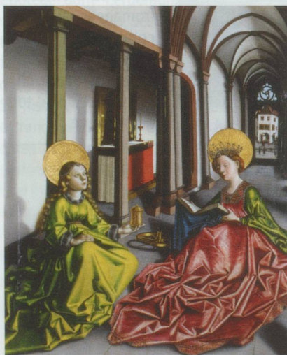
Konrad Witz (um 1400-um 1446) : Heilige Magdalena und Heilige Katharina in einer Kirche , um 1440 - Bild auf Fichte - Blatt : 162 x 130,4 x 0,8 cm - Strasbourg, Musée de l'œuvre Notre Dame - Foto : M. Bertola - Exposition Konrad Witz (Bâle)

Fondation de l'Hermitage, route du Signal 2, CH-1008 Lausanne. Jusqu'au 29 mai 2011, du mardi au dimanche de 10 h à 18 h, jeudi jusqu'à 21 h.