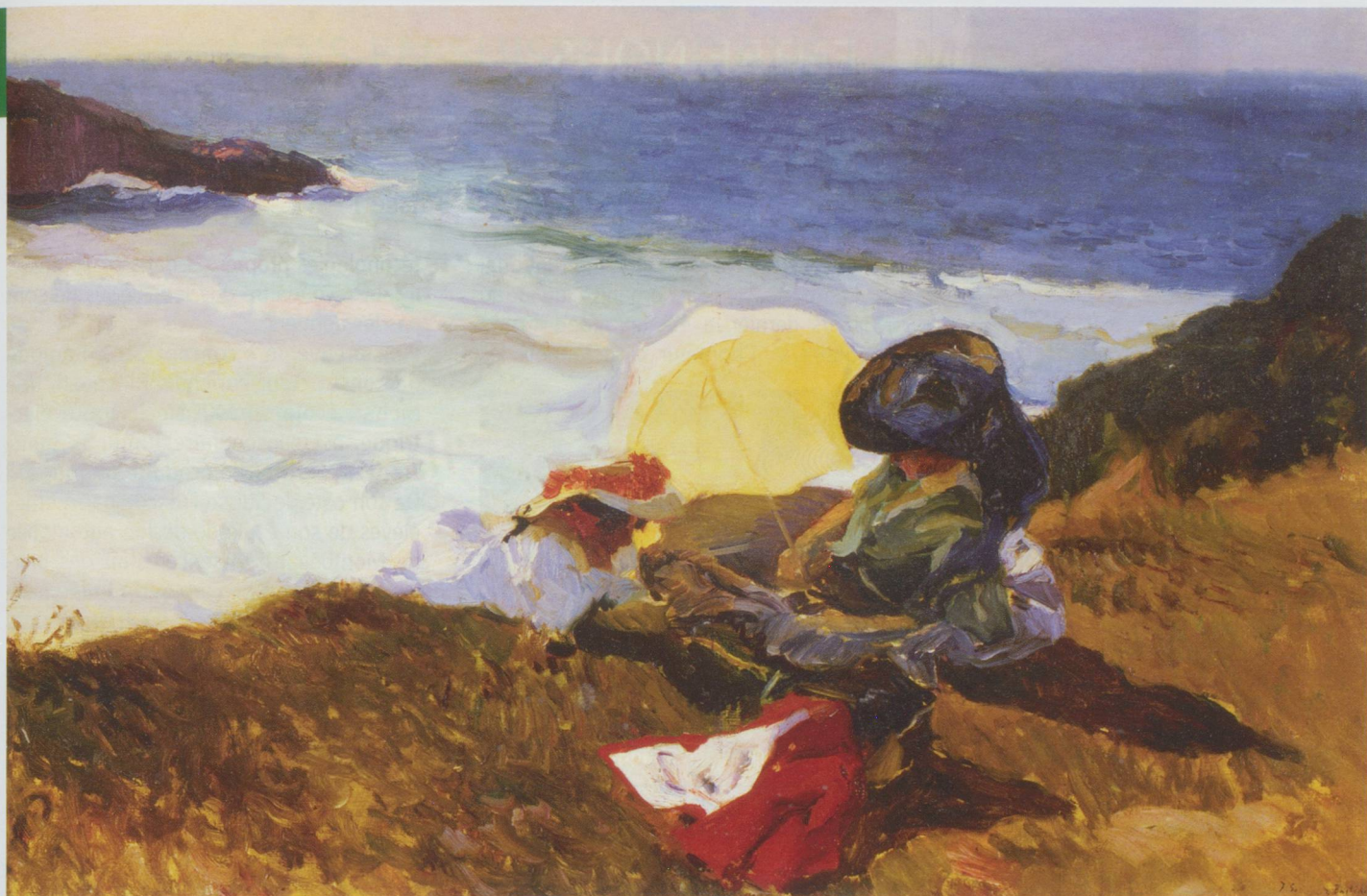
Joaquín Sorolla y Bastida : Soleil couchant, Biarritz, 1906 - huile sur toile, 62 x 94 cm - Coleccion Masaveu - © photo Gonzalo de la Serna Arenillas - Exposition El Modernismo - De Sorolla à Picasso (Lausanne)