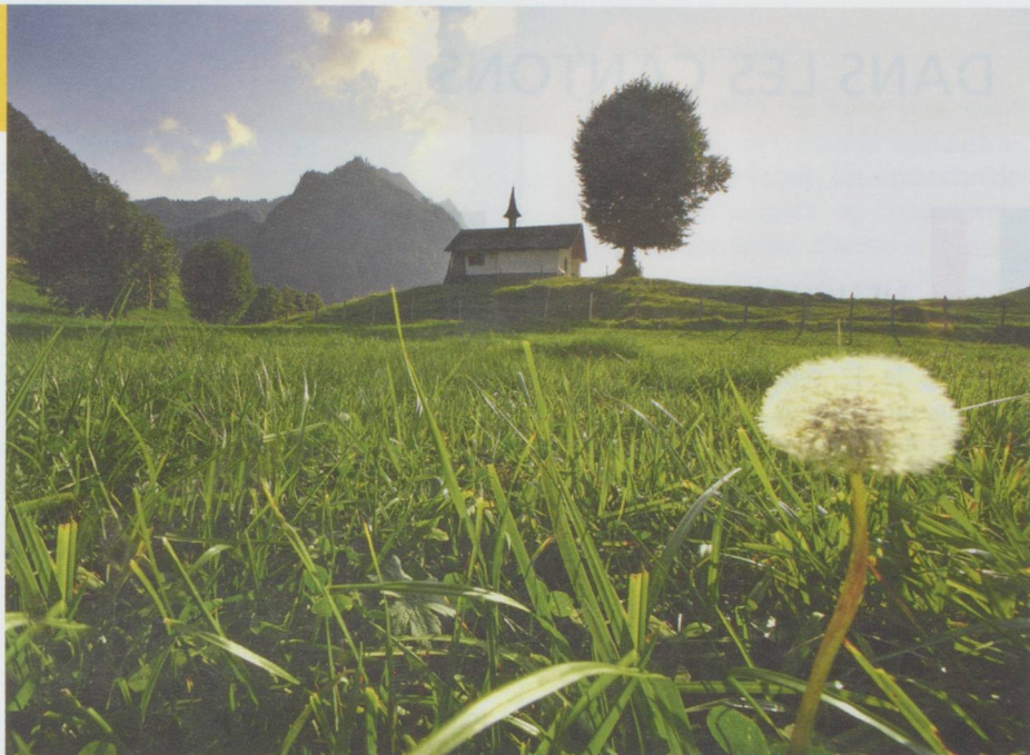
Chapelle sur l'alpage au-dessus de Charmey (FR)

■ Contrairement à la tendance suisse, le nombre d'infractions a augmenté d'envi-