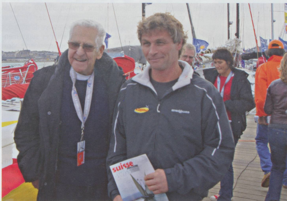
Suisse Magazine en bonnes mains

Le clair de lune est là pour l'accueillir sur la ligne d'arrivée après 19 jours 20 heures 51 minutes 51 secondes de course. Il est 9 e , c'est fabuleux et sans doute Pierre de