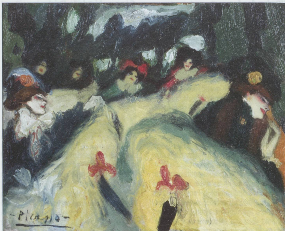
Pablo Ruiz Picasso : Le French Cancan, automne 1900, huile sur toile, 46 x 61 cm, collection privée,. Exposition El Modernismo – De Sorolla à Picasso 1888-1918 (Lausanne).

Jusqu'au 15 mai 2011, du mardi au dimanche de 10 h à 18 h.