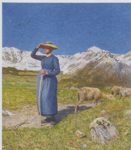
Giovanni Segantini : Mezzogiorno sulle Alpi, 1891, huile sur toile 77,5 x 71,5 cm, Musée Segantini, St. Moritz, prêt de longue durée de l'Otto Fischbacher Giovanni Segantini Stiftung. Exposition Segantini (Bâle).

Musique de Serge Prokofiev, chorégraphie de Joëlle Bouvier. Théâtre national de Chaillot, salle Jean Vilar, 1, place du Trocadéro, 75116 Paris. Renseignements au 01 53 65 30 00. Du 7 au 9 avril 2011, à 20 h 30.