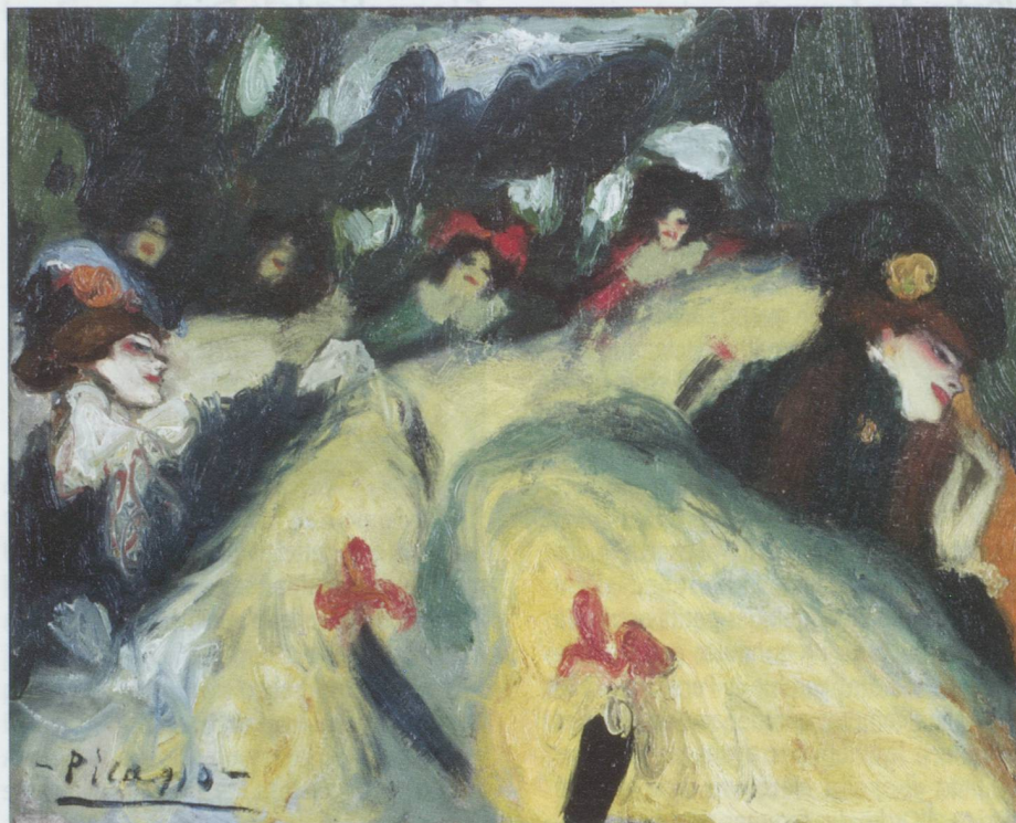
Pablo Ruiz Picasso : Le French Cancan, automne 1900, huile sur toile, 46 x 61 cm, collection privée,. Exposition El Modernismo – De Sorolla à Picasso 1888-1918 (Lausanne).

Jusqu'au 15 mai 2011, du mardi au dimanche de 10 h à 18 h.