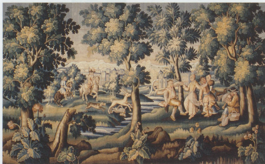
Ateliers d'Aubusson - Chasse au cerf, fin du XVII e s. (détail) Musée d'art et d'histoire Fribourg

Musée d'art et d'histoire, rue de Morat 12, CH-1700 Fribourg. Jusqu'au 27 février 2011, du mardi au dimanche de 11 h à 18 h, jeudi de 11 h à 20 h.