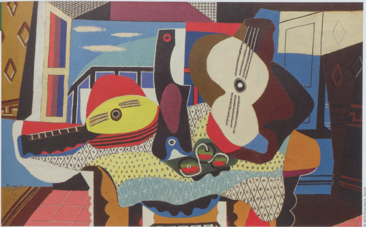
Pablo Picasso : Mandoline und Gitarre (Mandoline et guitare), 1924 Öl mit Sand auf Leinwand, 140,7 x 200,3 cm. Solomon R. Guggenheim Museum, New York