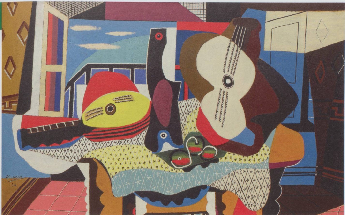
Pablo Picasso : Mandoline und Gitarre (Mandoline et guitare), 1924 Öl mit Sand auf Leinwand, 140,7 x 200,3 cm. Solomon R. Guggenheim Museum, New York