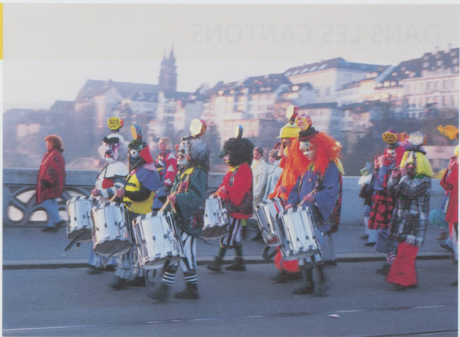
Carnaval de Bâle. Fifres et tambours traversant le pont du Rhin pendant le « charivari ».

■ Seize soldats ont été blessés lors d'une collision impliquant quatre chars de grena-