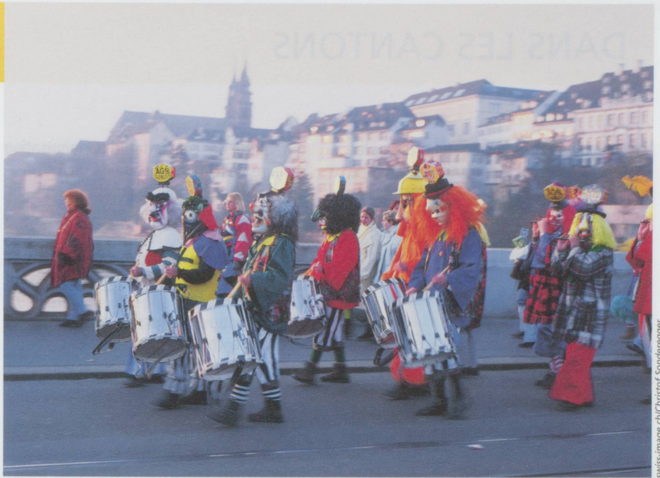
Carnaval de Bâle. Fifres et tambours traversant le pont du Rhin pendant le « charivari ».

■ Seize soldats ont été blessés lors d'une collision impliquant quatre chars de grena-