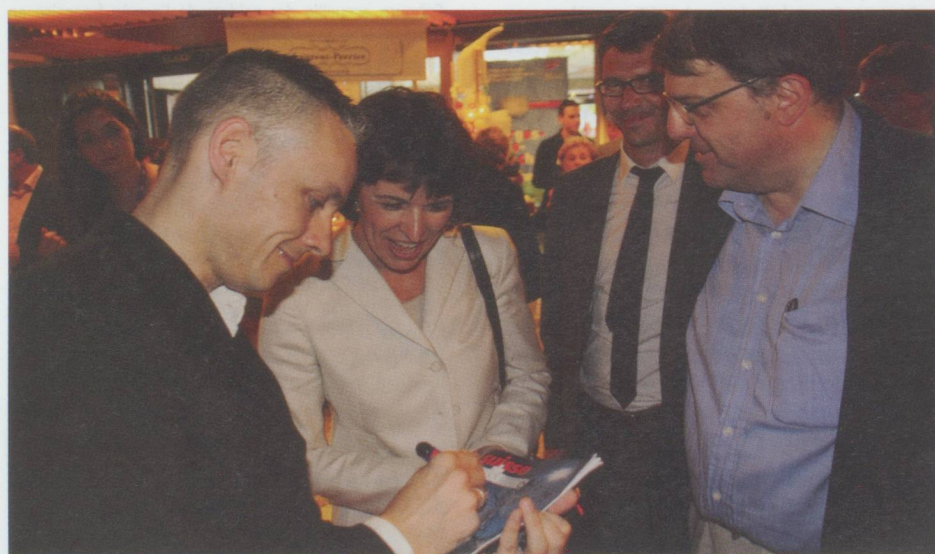
La présidente de la Confédération ne repartira pas sans son Suisse Magazine et son dessin vache